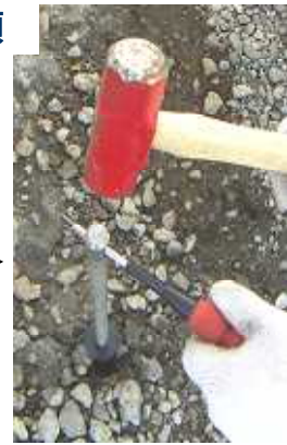
心金を差込みパッカが気密するまで挿入