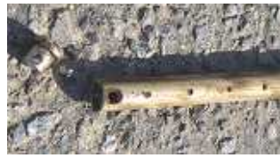
先端を外して洗浄できます