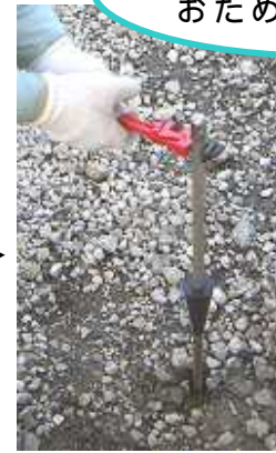
心金を再挿入 ハイクレンチを使って引抜き