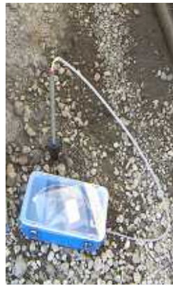
静置後 採取管を挿入し土壤ガスを採取