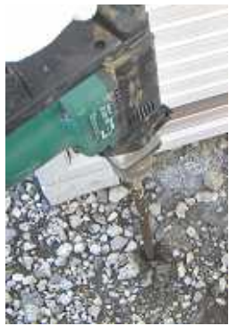
ハンマドリルによる掘削 20mm 以上