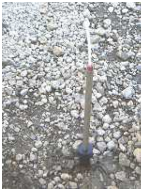
採取管を挿入した状態