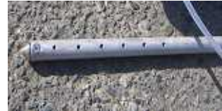
材質はステンレス