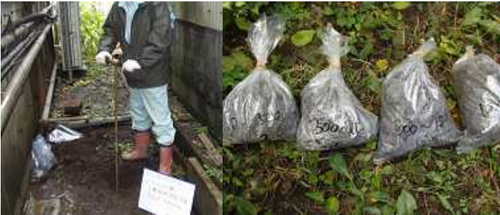
左图：使用简易钻杆采土样 右图：采集的土壤样本

钻取设备不能进入的狭窄场所，我们就用简易钻杆钻取土样，通过分析土样把握深度方向的污染分布情况。