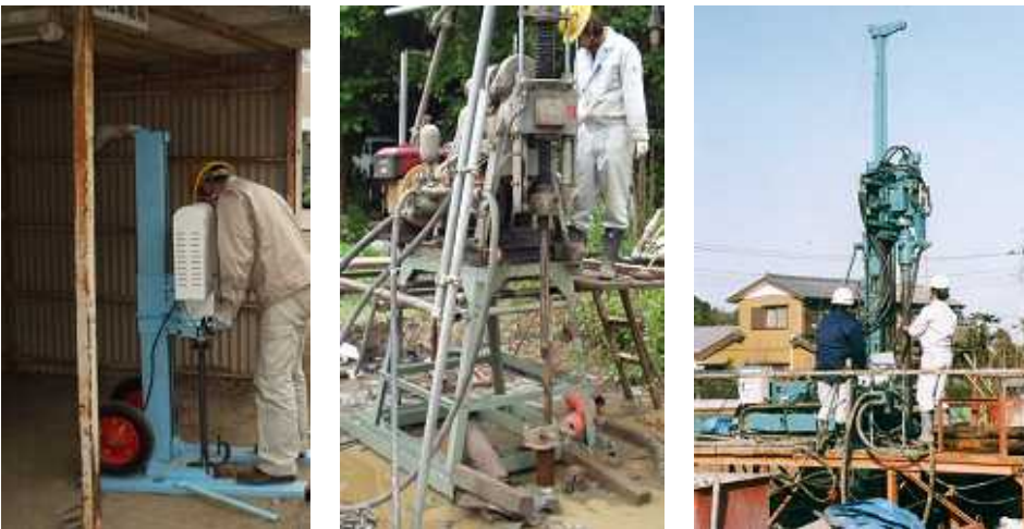
左图：手推钻取机 中图：回转式钻取机 右图：回转打击式钻取机

进行更详细的污染调查，我们就使用钻取设备。手推钻取机适用深度 5M 内的土壤采样。回转打击式钻取机可用于钻取困难的砂砾层，深度可达 100M 以上。