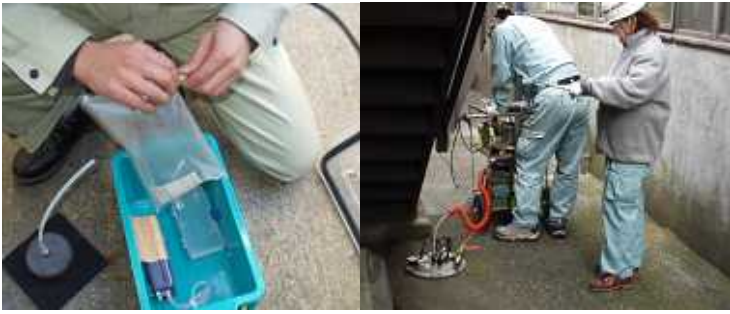
左图：土壤气体调查 右图：室外规划点表层调查

挥发性有机化合物（VOCs）等的挥发性物质的调查方法：采集地下空气，测定污染浓度。通过定间隔多地点的浓度测定，分析污染分布情况。