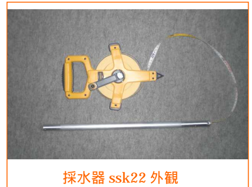
採水器 ssk22 外観

環境調査に携わる技術者のみなさん 廃棄物を削減しましょう 石油製品の使い捨て をやめましょう！ ちょっと手間はかかるけど アルミ材なので ちゃんと洗浄すれば繰り返し使えます