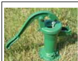
セロリ村のカントリポンプ