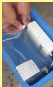
④ガス採取管と土壌ガス採取器、土壌ガス採取器と捕集バッグを接続。