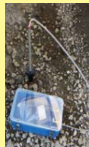
⑤ポンプの電源を入れてフタを閉める。土壌ガスが捕集バッグに吸い込まれたら、フタを開けて、ポンプの電源を切る。捕集バッグのネジフタを閉めて終了。

各種土壌調査機器・対策プラント機器等の設計・製造・販売 ご要望に合わせてオリジナル製品の開発も承ります