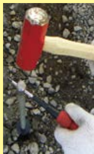
②土壌ガス採取孔保護管をパッカが気密するまで挿入。