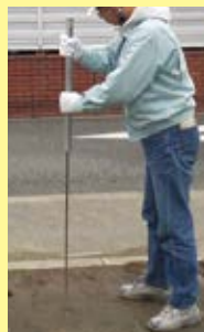
①ボーリングバーなどで採取孔を掘削。