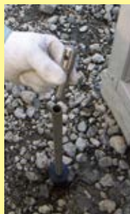
③静置後、土壌ガス採取孔保護管の上端から芯金または穴なしゴム栓を外して、ガス採取管を挿入。