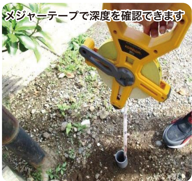
メジャーテープで深度を確認できます